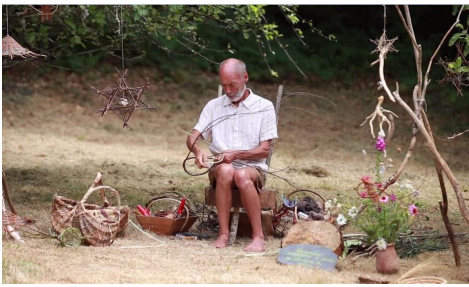
Atelier de vannerie